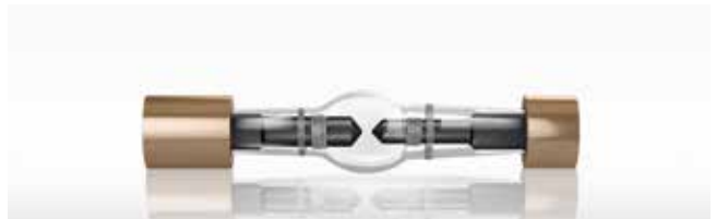
キセノンショートアークランプ

キセノンショートアークランプの連続光は、原子吸光分析の測定範囲をすべてカバーしています。原子吸光分析でランプ交換が必要なのは過去のことです。ホロカソードランプを使用する装置と比較して、交換コストは大幅に低くなり、一方で光の強度は大幅に高くなります。強度の高さは優れた S/N 比を実現し、検出限界の向上をもたらします。測定可能な波長範囲のあらゆる元素を第1または第2波長で分析することができます。contrAA 800 は金属や半金属に加えて、硫黄、リン、フッ素、ハロゲンなどの非金属も分子吸収を評価することで測定が可能となり、アプリケーションの適用範囲が広がります。