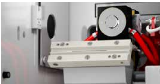
contrAA 800 Dは1つのサンプルコンパートメントでフレイム法とファーネス法の使用ができます。

contrAA 800 は、研究者の実際の経験に基づき、研究者のために、できるだけコンパクトで使いやすいように開発されました。デュアルアトマイザーの設計は、フレイム法とグラファイトファーネス法の両方のアトマイザーをコンパクトに組み込むことにより、設置面積を最小に抑え、パフォーマンスを最大化します。簡単な操作だけで、原子化部の自動切換えと2次元の位置調整が行われるので、柔軟に切り替えが可能です。